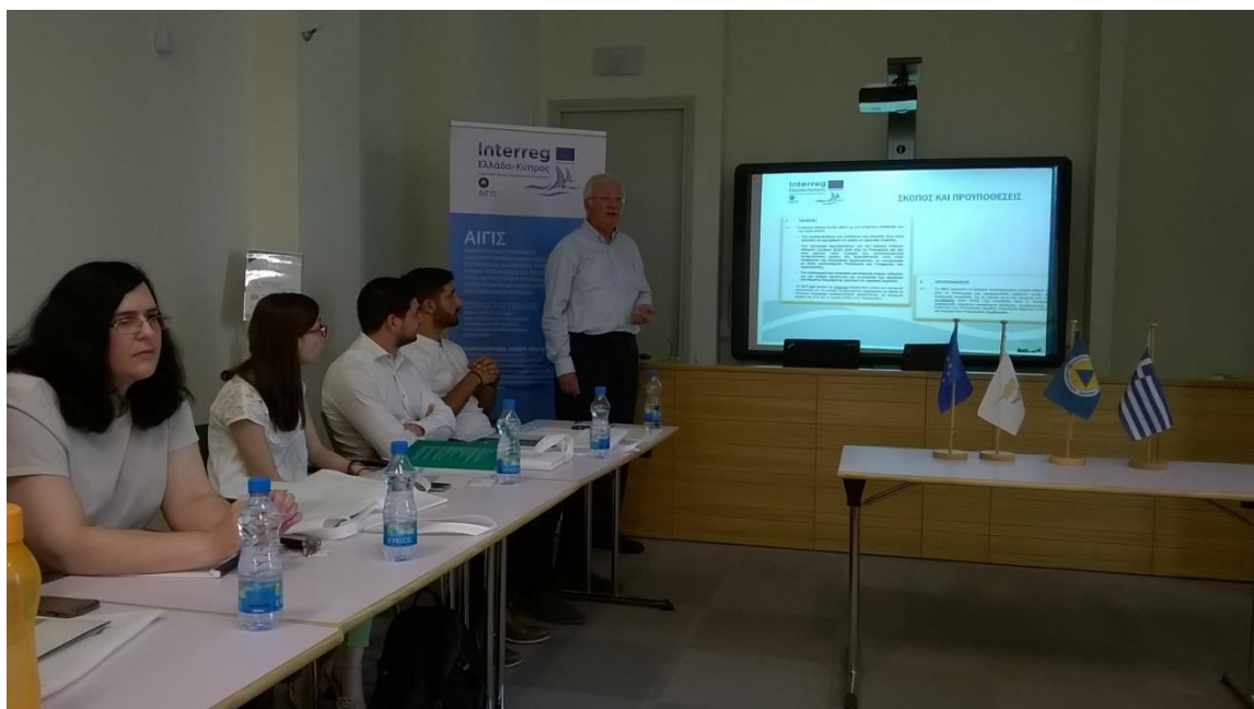
Συνάντηση της Επιτροπής Παρακολούθησης, στη δημοτική βιβλιοθήκη Λεμεσού

Νέα ιστοσελίδα Πολιτικής Άμυνας www.civildefence.com.cy Από εκεί find us on Fb