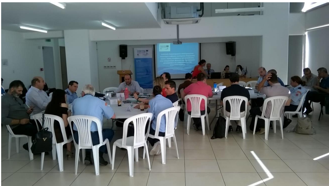
Άσκηση στο κτίριο της Διοίκησης Πολιτικής Άμυνας